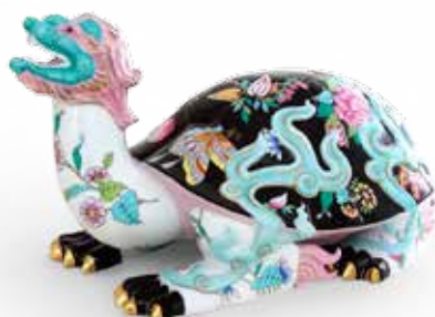
Sárkányteknős 05947000 SP225VT

Lepje meg szeretteit a Herendi Porcelánok örök eleganciájával! Válogasson kedvére a több ezer kézzel festett egyedi termékünk közül! Várjuk szeretettel márkaboltjainkban!