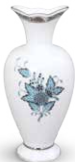
Váza 07053000 ATQ3-PT