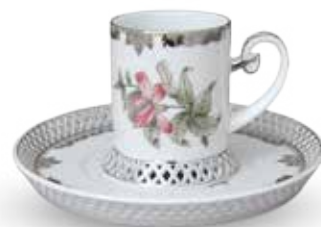
Kávéscsésze aljjal 04754000 VBOG-XI-PT