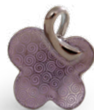
Medál 08176000 ORIENTL-PT