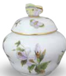
Bonbonier 06092017 EVICT1