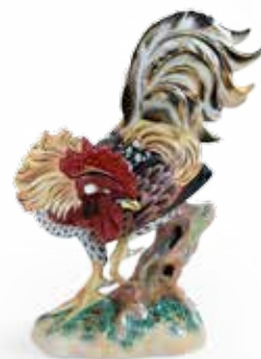
Kakas 05019000 VHSP22