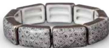
Karkötő 08163091 VOLN-PT