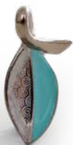
Medál 08169000 ORIENTTQPT