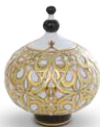
Bonbonier 06874015 EVE5